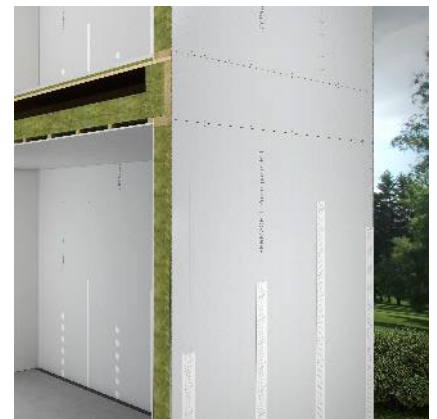
Paroi extérieure fermacell™