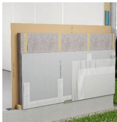
Paroi à ossature bois fermacell®