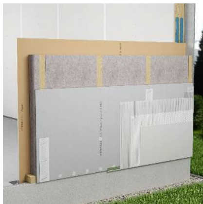
Paroi à ossature bois fermacell®

La bande fermacell™ Tape AWS s'applique sur les joints de plaques fermacell® Powerpanel HD/H 2 O avant d'application un système de crépi. Pour cela, placer la bande fermacell™ Tape AWS sur l'axe du joint des plaques fermacell® Powerpanel HD/H 2 O, en appuyant de façon continue sur la bande et en prenant soin de ne pas créer de plis. Les têtes de fixation qui ne sont pas situées vers les joints de plaques, peuvent être recouvert avec la bande fermacell™ Tape AWS ou être traitées avec la colle de renforcement fermacell® Powerpanel HD. En extérieur, la bande fermacell™ Tape AWS sera ensuite recouverte directement par le système de crépi en respectant les préconisations de pose énoncées notamment dans nos guides de pose.