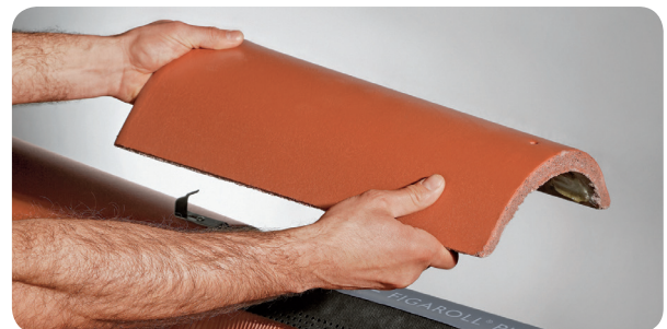
d) Fixer la faîtière à l'aide de crochet faîtière sur la latte de faîte.