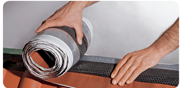
a) Dérouler entièrement le Figaroll Plus sur le faîtage ou l'arête.

Extension des bavettes latérales: env. 50 %