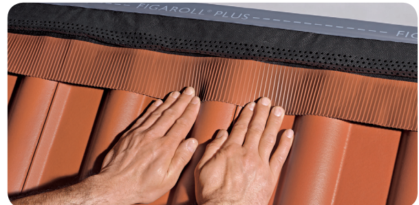
c) Déplier les jupes du Figaroll Plus afin qu'il s'adapte au profil de la tuile. Retirer les bandes de protection du butyle.