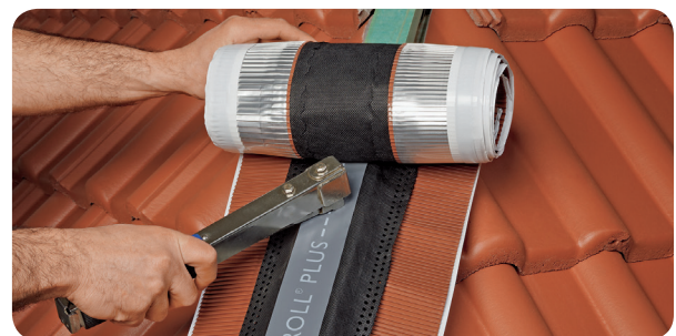
b) Fixer le Figaroll Plus à l'axe sur la latte de rehausse à l'aide d'agrafes ou de clous.