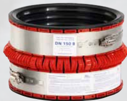
Manchon d'adaptation VPC®

Pour le raccordement de tuyaux en matière plastique avec des tuyaux en béton ronds de diamètres nominaux DN 250 à 800, il existe un adaptateur qui compense la grande différence d'épaisseur de paroi qu'il y a toujours, compte tenu des caractéristiques des matériaux en question. Pour le raccordement de tuyaux en matière plastique avec des tuyaux en béton ronds de diamètre nominal DN 150, il existe une solution spéciale sous la forme d'un petit adaptateur. Les adaptateurs et manchettes pour les plages de DN 250 à DN 800 sont disponibles séparément. Les composants nécessaires à la transition à un tuyau circulaire en béton DN 150 sont disponibles en kit complet (numéro d'article VPC 150 B).