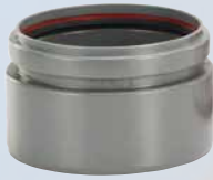
Adaptateur pour solution spéciale DN 150