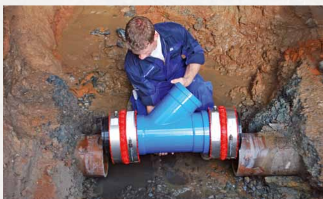
Ajout après coup d'un branchement dans une conduite en grès déjà posée