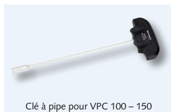
Clé à pipe pour VPC 100 – 150