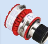
DN 100 à DN 125