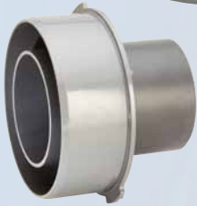
Adaptateur VPC KB pour raccordement matière plastique (PE, PP, PVC) au tuyau béton rond DN 250 – DN 800