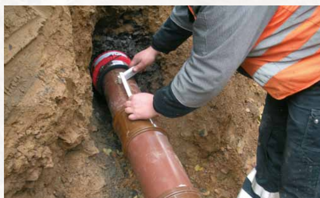
Réparation de conduites défectueuses