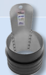
DN 150 à DN 600

En cas de transition de tuyaux à géométrie extérieure non circulaire, l'adaptateur BI Funke est disponible pour les diamètres nominaux du DN 100 au DN 600.