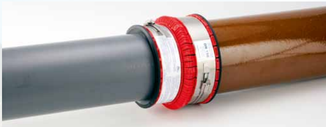
... un tuyau CR 8 PVC-U et un tuyau gris ...