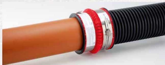
... tuyau CR 4 PVC-U et un tuyau annelé ...