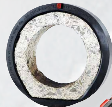
Tuyau en béton à fond plat avec adaptateur VPC 150 BF enfilé ...

Lors du montage, placer l'adaptateur 150 BF sur le tuyau en béton avec base aplatie de manière à ce qu'il se cale parfaitement contre le bord en béton. Enfiler ensuite le manchon VPC® et procéder au montage en suivant les instructions fournies dans le manuel de pose. Ensuite, positionner l'adaptateur VPC KB devant le tuyau en béton et procéder au raccordement en suivant le manuel de pose. Les deux composants font partie du kit livré.