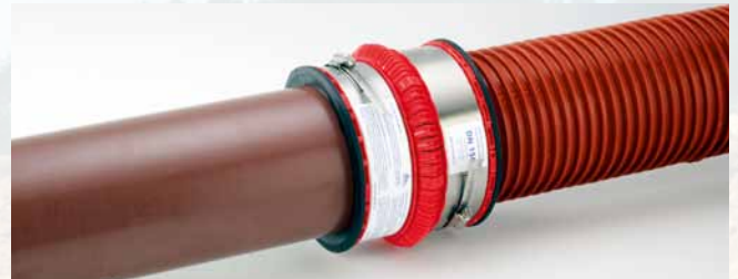
... un tuyau CR 12 (HSK) PVC-U et un tuyau à ailettes.