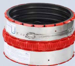
Manchon d'adaptation VPC®