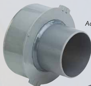
Adaptateur VPC KB