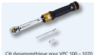
Clé dynamométrique pour VPC 100 – 1070