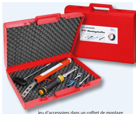
Jeu d'accessoires dans un coffret de montage