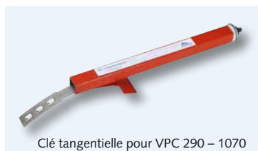
Clé tangentielle pour VPC 290 – 1070