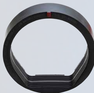
Adaptateur VPC 150 BF

La version VPC 150 BF du manchon VPC® Funke (pour les tuyaux en béton de diamètre extérieur de 210 à 215 mm) est également utilisable pour le raccordement d'un tuyau en béton à fond plat. Pour ce faire, l'adaptateur VPC KB et l'adaptateur VPC 150 BF sont nécessaires. Pour les autres diamètres nominaux, l'adaptateur BI Funke est disponible.