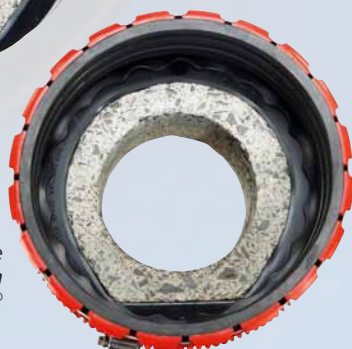
... et à l'étape suivante avec manchon d'adaptation VPC®