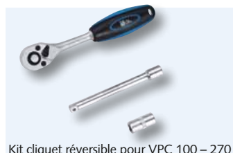
Kit cliquet réversible pour VPC 100 – 270