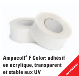
Ampacoll® F Color: adhésif en acrylique, transparent et stable aux UV