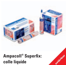
Ampacoll® Superfix: colle liquide