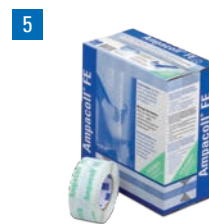
Ampacoll® FE: Ruban pour la pose des fenêtres