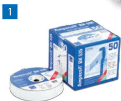
Ampacoll® BK 535: Ruban adhésif en caoutchouc butyle