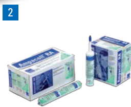
Ampacoll® RA: Colle liquide