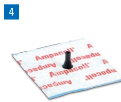
Ampacoll® Elektro u. Install: Manchettes