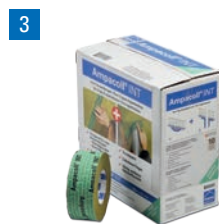
Ampacoll® INT: Ruban adhésif acrylique