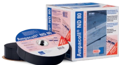
Ampacoll® ND 80 : taquets d'étanchéité pour clous, largeur 80 mm