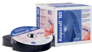
Ampacoll® ND 60 : taquets d'étanchéité pour clous, largeur 60 mm