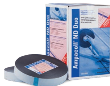
Ampacoll® ND Duo : bande d'étanchéité à double face adhésive pour clous