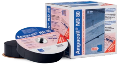
Ampacoll® ND 80 : taquets d'étanchéité pour clous, largeur 80 mm