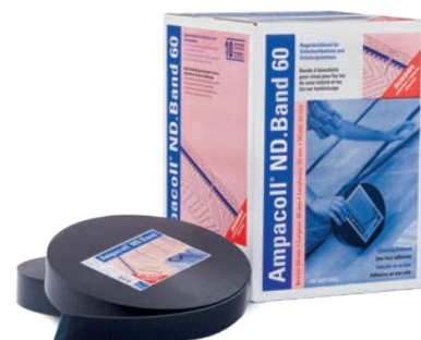
Ampacoll® ND.Band 60/80 : bande d'étanchéité à simple face adhésive pour clous, 60/80 mm de large