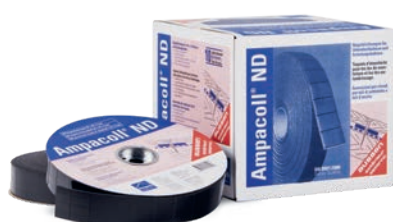
Ampacoll® ND 60 : taquets d'étanchéité pour clous, largeur 60 mm